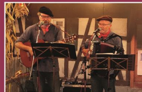
Sonntag, 17. September Hons un Frons