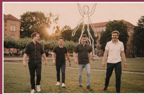
Sonntag, 13. August HIPSHAKER