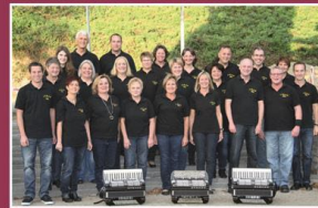
Sonntag, 20. August Harmonikafreunde Lauf e.V.