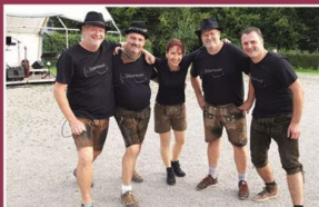
Sonntag, 3. September SCHORLEXAID